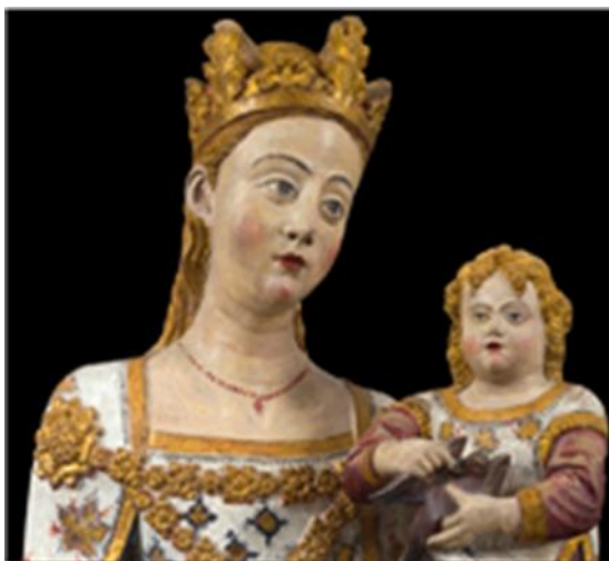
Mare de Déu de Bellpuig de les Avellanes. Museu de Lleida

Cantigas de Santa María (s. XIII) y Llibre Vermell de Montserrat (s. XIV) están dedicados en su totalidad a la Virgen María, así como un altísimo porcentaje de las obras del Códice de Las Huelgas (que, aunque confeccionado en el XIV, recopila obras muy anteriores).