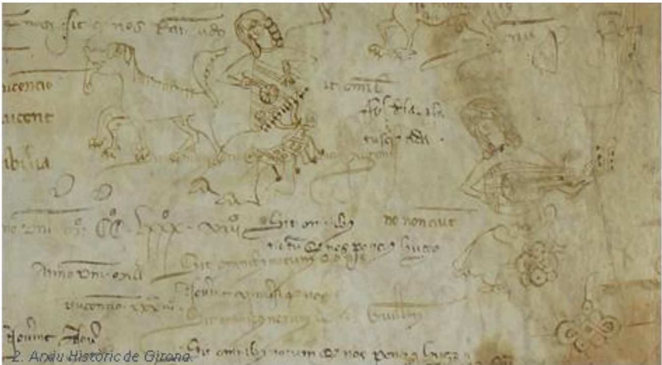
Arxiu Històric de Girona

Es importante destacar su participación en diversas producciones operísticas, como las de “Le Nozze di Figaro” y “Die Zauberflöte” de W. A. Mozart para el Opéra Studio de Genève; en el Stadt Theater Basel de la ópera de Claudio Monteverdi “L’Incoronazione di Poppea”, bajo la dirección musical de Konrad Junghänel, y escénica de Nigel Lowery; y la première del “Farnace” de Francesco Corbelli en el Auditorio Nacional de Madrid con la Capilla Real de Madrid.